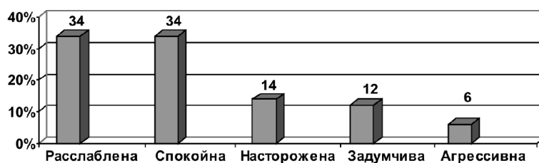
Рис. 2. Оценка осужденными женщинами своего эмоционального состояния после групповых сессий

Известно, что доминирующим мотивом употребления осужденными наркотиков является надежда уйти с их помощью от жизненных осложнений. Именно осложнения такого рода порождают необычайно сильное и неприятное чувство внутреннего психического напряжения, которое лишает человека естественных отношений и требует обязательной разрядки. Коррекционное воздействие на эту группу должно быть нацелено на формирование необходимого умения преодолевать трудности адаптации. Трудности добывания в условиях лишения свободы наркотических средств для снятия стрессовых состояний провоцируют осужденных женщин на демонстрацию независимости и физической силы, грубости, пренеб-